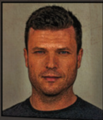
DANIEL PINHEIRO Fotógrafo e realizador português, especializado em história natural